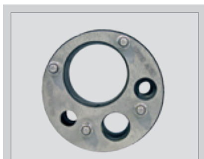
Provedení s více průchodkami

Nerezové těsnicí sady také z materiálu se zkouškou KTW pro oblast pitné vody – ceny na poptání.